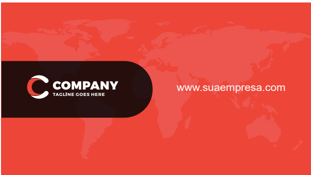
Página 02 (Impressão Verso)

*Atenção: A grade 4x1 o verso tem que ser enviado somente com porcentagem de preto(k)