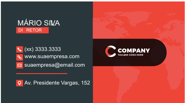
Página 01 (Impressão Frente)