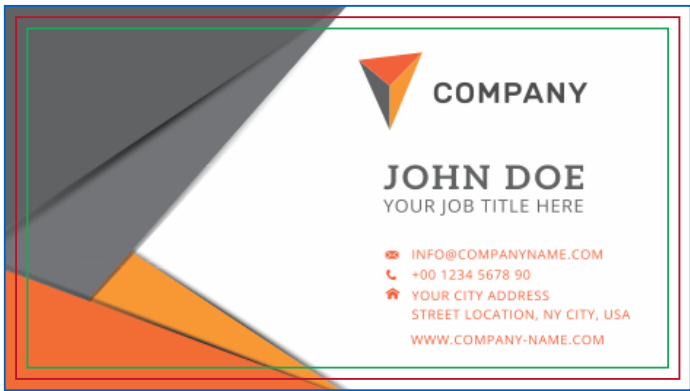
Página 01 (Impressão Frente)

Se a arte for em pé (vertical) envie no formato deitado (horizontal).